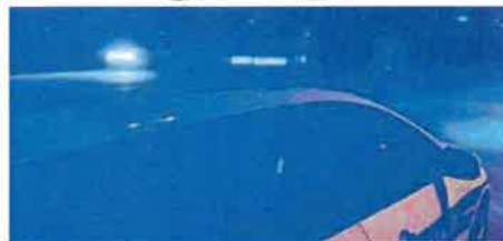
Policija je provela kriminalističko istraživanje

uhićena i dovedena u prostorije policije gdje su 30-godišnjak i 28-godišnjak odbili alkotestiranje dok je kod 33-godišnjaka utvrđena prisutnost alkohola u organizmu. Nakon provedenog kriminalističkog istraživanja, zbog kaznenog djela prisila prema službenoj osobi, protiv osumnjičenog 28-godišnjaka podnesena je kaznena prijava nadležnom državnom odvjetništvu, dok se protiv