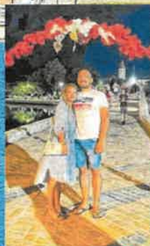
Mladi parovi već više godina iz romantičnog gradića nose lijepe uspomene