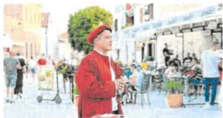
Kostimirano turističko vođenje jedna je od ninskih prepoznatljivosti