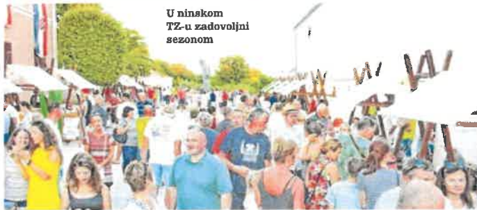
U ninskom TZ-u zadovoljni sezonom

- Gosti to primjećuju, redovno bilježimo njihove pohvale terena za konstantan rast urbanističkog uređenja grada. Zadovoljan gost se uvijek vraća pa