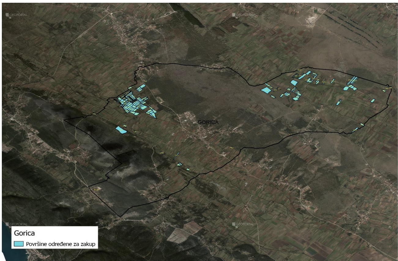
Slika 3: Površine određene za davanje u zakup